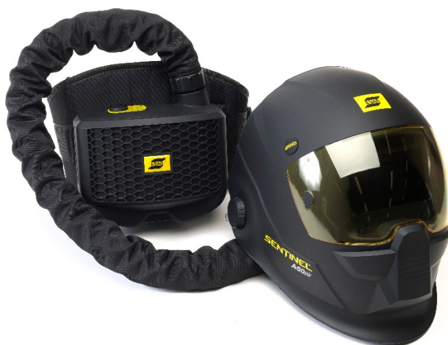
SENTINEL A50 Air avec unité ESAB PAPP